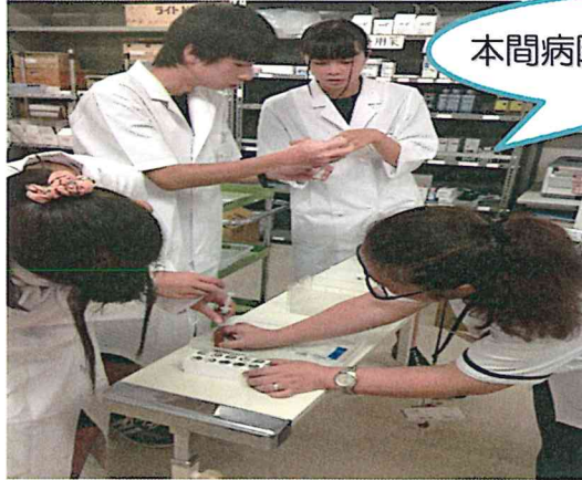
本間病院薬剤科にて配合変化実験