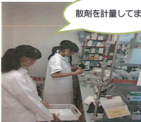
散剤を計量してまーす！

8/5(金) ひまわり薬局で、将来薬剤師を目指す生徒さんや、まだ進路の決まっていない生徒さんを対象に「高校生薬剤師体験」を行いました。保険薬局や病院での薬剤師の仕事を実際に見学、体験していただくことで、将来の目標を確かなものにするきっかけ作りができればという思いを込めての企画です(^_^)