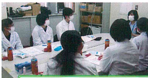
新人薬剤師からのお話