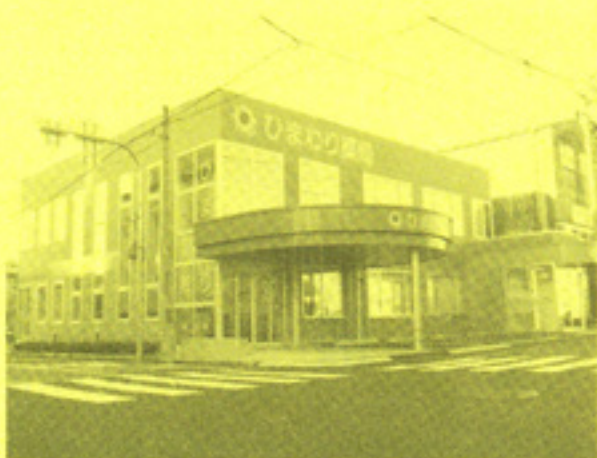
(新)ひまわり薬局 外観