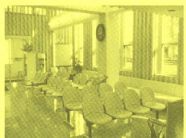
ゆったりとした待合室