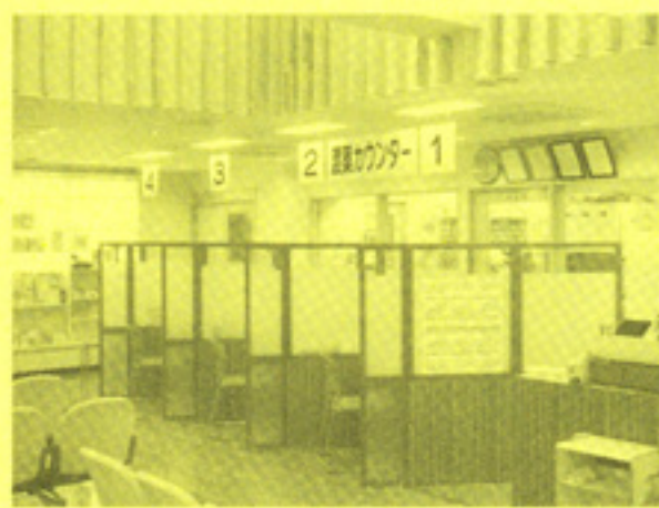
プライバシーの保てる渡薬カウンター